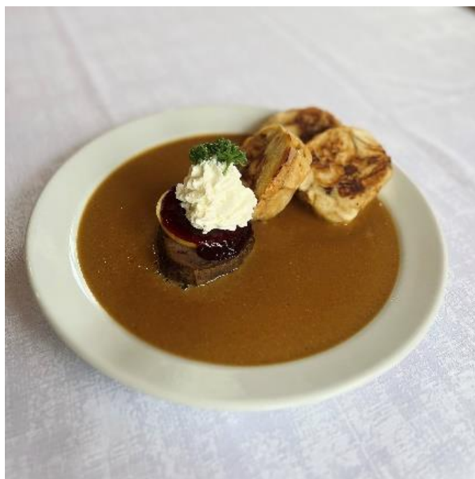
Hovězí svíčková se špekovým knedlíkem, brusinkami a šlehačkou