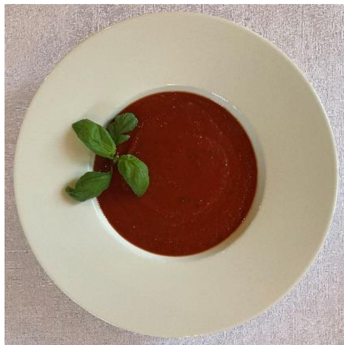
Rajčatová polévka s bazalkou