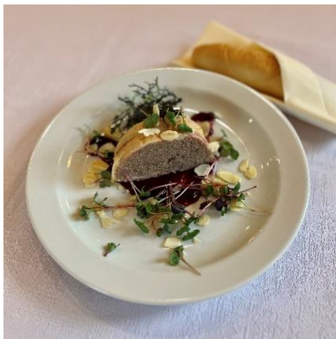
Kachní paštika s brusinkami, mandlemi a banketkou