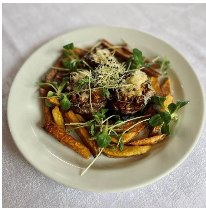
Portobello plněné zeleninovou salsou, zapečené parmezánem s hranolky