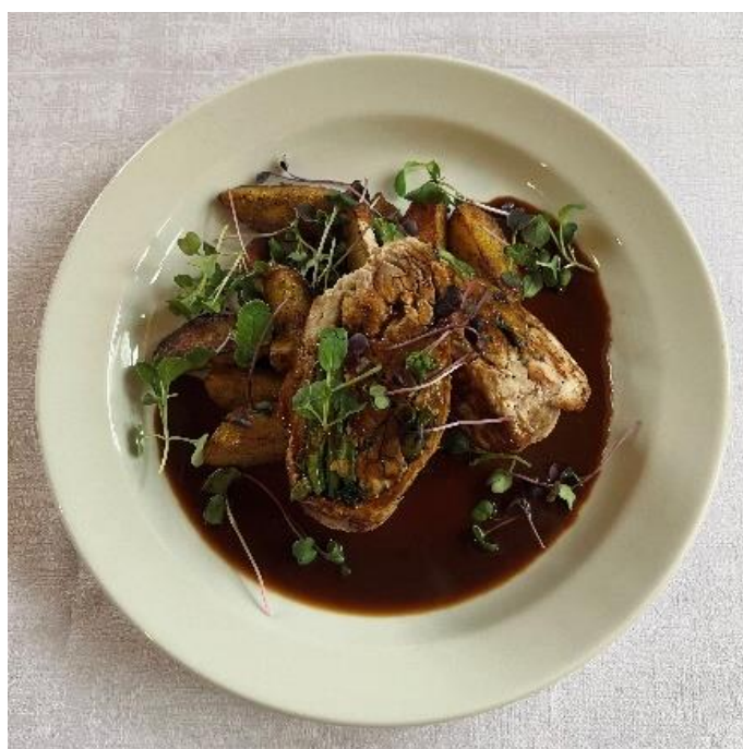
Vepřová kapsa z kotlety plněná žampionovou směsí s gratinovanými brambory