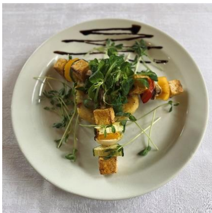
Grilovaný zeleninový špíz z tofu se šťouchanými brambory