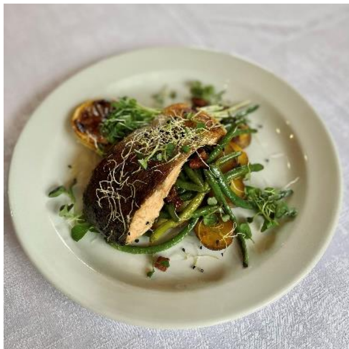
Grilovaný lososovitý pstruh na zelných fazolkách s opékanými brambory