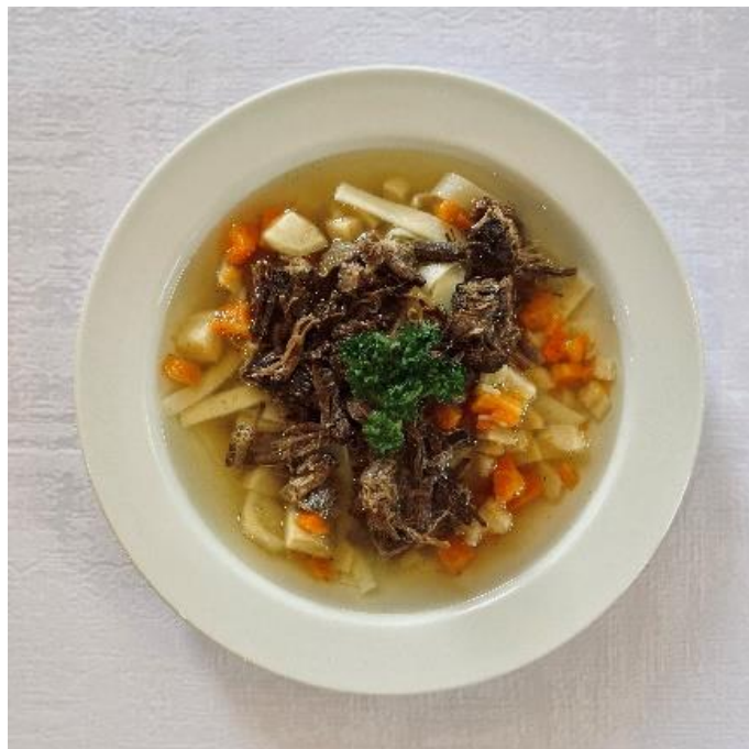
Hovězí vývar s masem, játrovou rýží, zeleninou a domácími nudlemi