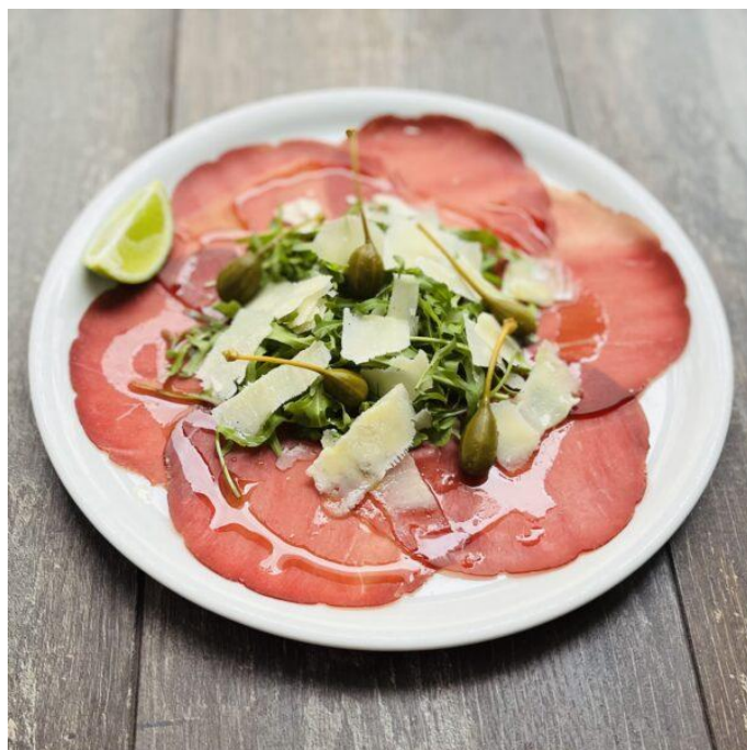
Hovězí Carpaccio s toastem