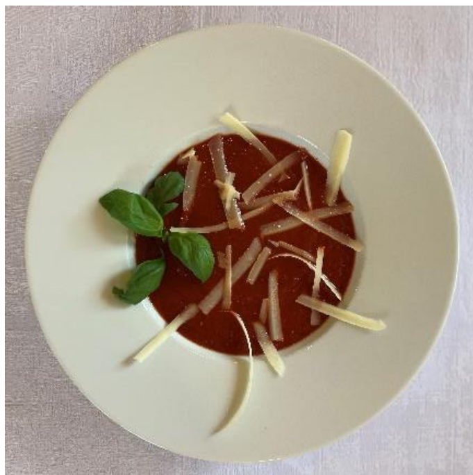
Rajčatová polévka s parmezánem a bazalkou