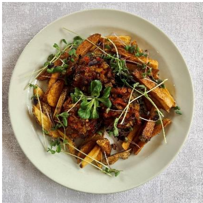
Portobello plněné zeleninovou salsou s hranolky