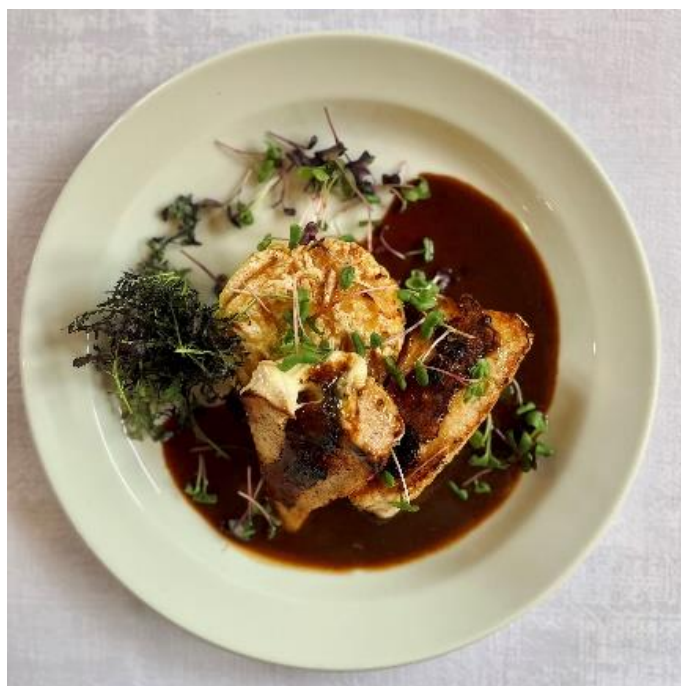
Kuřecí prso plněné sušenými rajčaty a mozzarellou s gratinovanými brambory