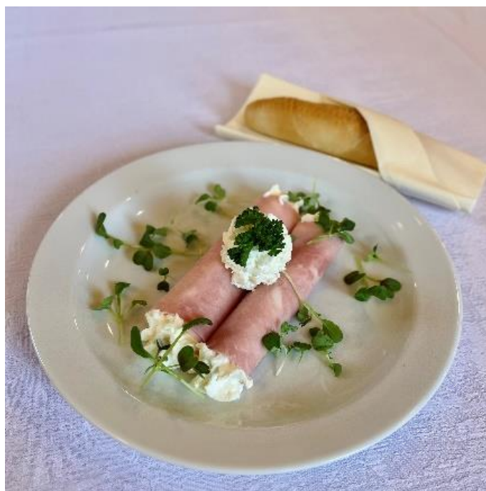
Šunková rolka s křenovou šlehačkou a banketkou