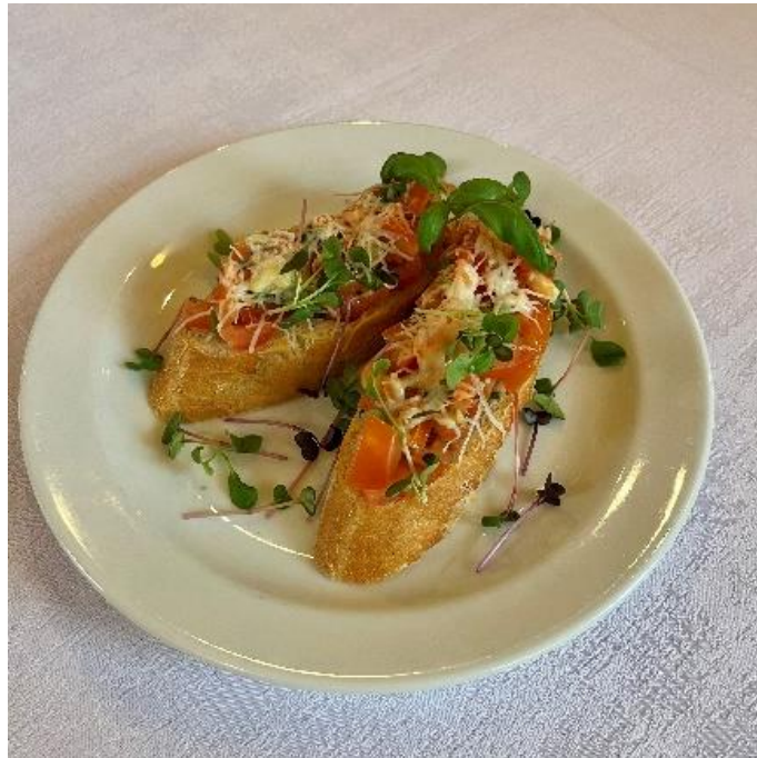
Bruschetta s rajčaty a parmezánem