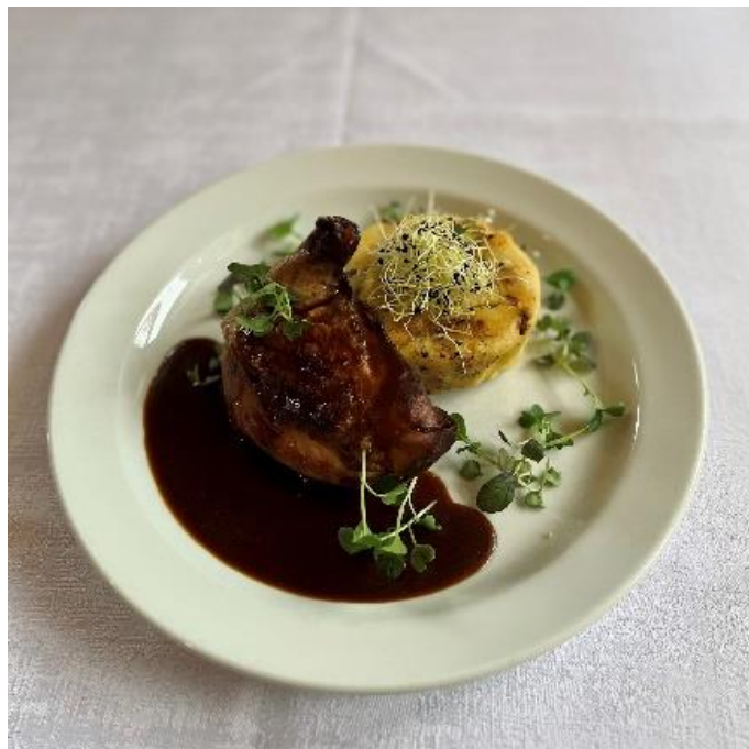
Kuřecí Supreme s Demi Glace a šfouchanými brambory