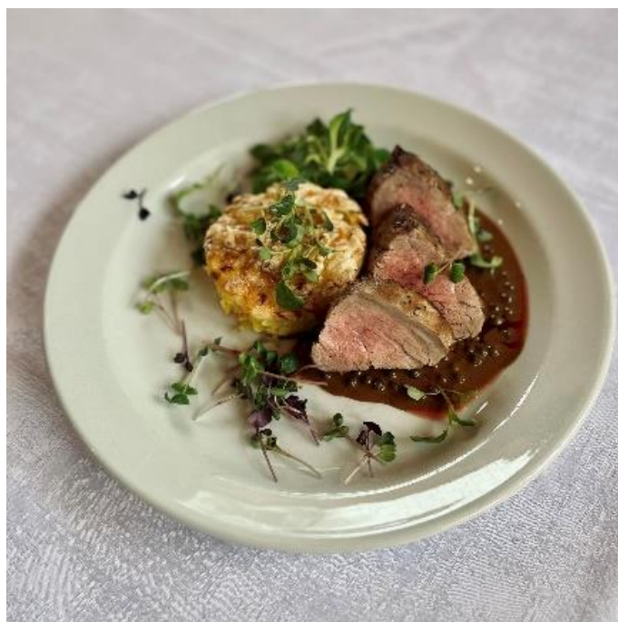
Vepřová panenka s pepřovou omáčkou a gratinovanými brambory