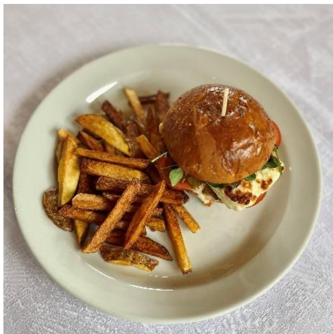
Halloumiburger s cibulovou omáčkou a hranolky