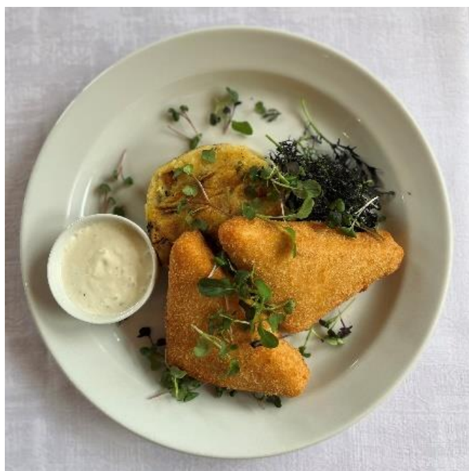
Smažený sýr se šfouchanými brambory a tatarskou omáčkou